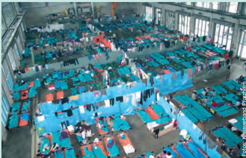
Notlager: 500 Feldbetten wurden in der Landesfeuerwehrschule in Bruchsal aufgestellt, dicht an dicht.

Es ist wichtig, nicht bei Sofortmaßnahmen stehen zu bleiben, sondern eine nachhaltige Verbesserung der Situation von Flüchtlingen in Deutschland zu erreichen.“ Neben einer menschenwürdigen Unterbringung und medizinischen Versorgung gehören dazu Bera-