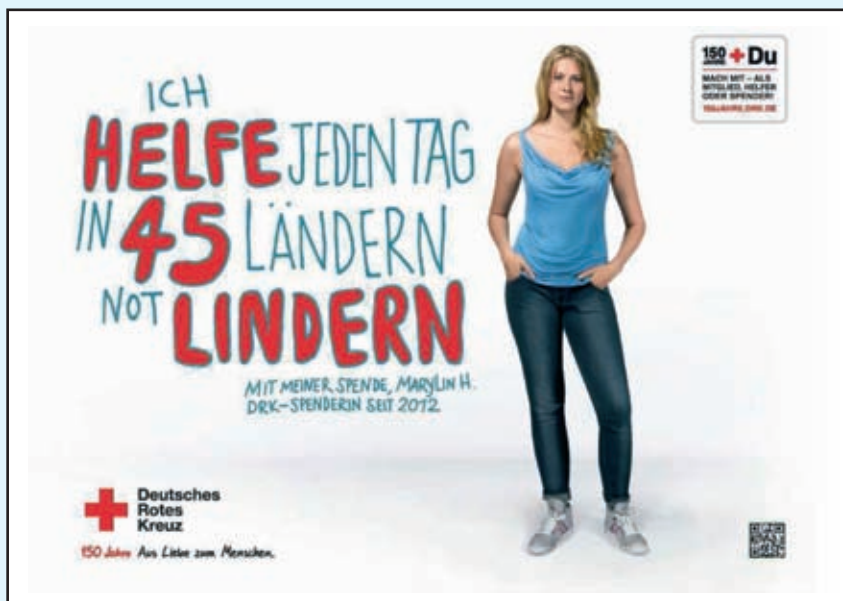
Plakatentwürfe zur Jubiläumskampagne, Stand Herbst 2012

Seit Anfang Dezember ist die Internetseite 150jahre.drk.de freigeschaltet. Hier gibt es neben der Verbindung von Historie und aktuellen Leistungen des DRK einen Zeitstrahl, der historische Fakten veranschaulicht, kurze Videos von Menschen, die über ihr Engagement berichten sowie einen „Aktivierungsbereich“, der die Möglichkeit bietet, sich sofort zu engagieren. Begleitend dazu gibt es die Internet-Plattform „Dunant-wissen“, eine Bildungsplattform zum Leben und Werk Henry Dunants und dem Roten Kreuz, aufgearbeitet für Schüler, junge Menschen und Erwachsene mit Arbeitsblättern und Unterrichtsmaterialien.