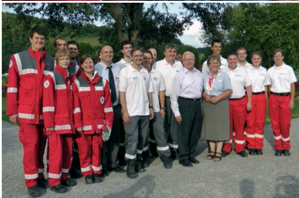
Den 52. Landesentscheid der Bereitschaften hat die Gruppe aus Maulbronn (Mitte) für sich entschieden. Überraschungszweiter wurde das Team aus Rottweil (r.), der dritte Platz ging an Ravensburg (l.).