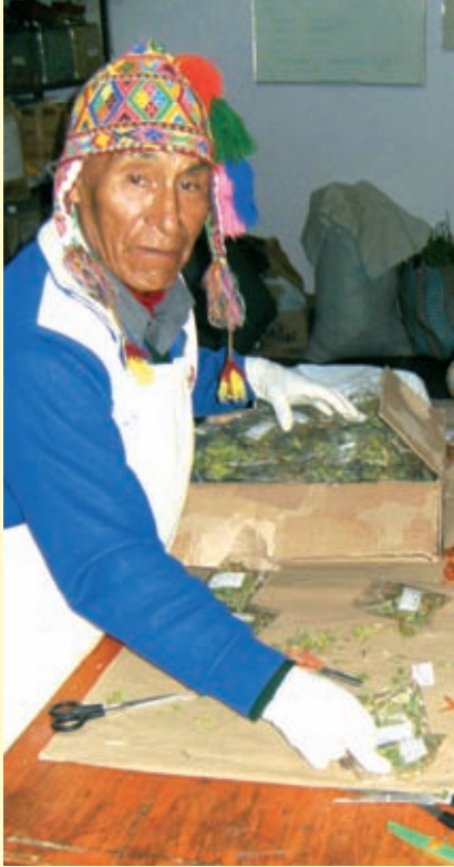
Ein Heiler aus der Gruppe YACHAQ.

schreckt viele Ärzte und Schwestern ab. Dort müssen sich die Bewohner selbst helfen. Daher hat es sich YACHAQ zum Ziel gesetzt, Patienten in ihren Landapotheken kostenlos zu behandeln. Außerdem organisiert die Gruppe Gesundheitskampagnen für die hoch gelegenen Regionen.